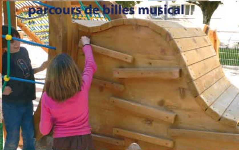
parcours de billes musical